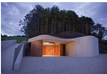
OFIS arhitekti, Farewell Chapel, 2005-2009 Krasnja, Slowenien